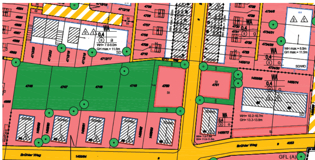
Bebauungsplan „Siedlung, 1. Änderung“, in Kraft getreten am 23.11.2006

Die neu zu pflanzenden Bäume im östlichen Geltungsbereich werden nach Westen versetzt, damit sie sich nicht im Bereich der Tiefgarage befinden. Der im rechtsgültigen Plan eingetragene Bestandsbaum, der zu erhalten ist, ist an der eingetragenen Stelle nicht mehr vorhanden und wird durch eine Neupflanzung entsprechend der Planzeichnung ersetzt.