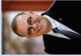
Dr. Gebhard Fürst Bischof der Diözese Rottenburg-Stuttgart