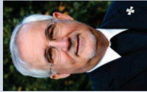
Stephan Burger Erzbischof der Erzdiözese Freiburg