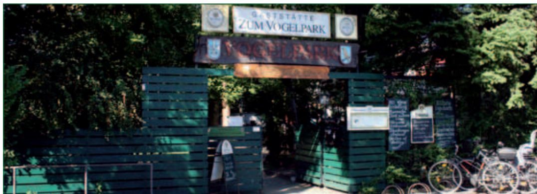
Eingang zum Vogelpark

Weitere Informationen erhalten Sie bei der Geschäftsstelle des Kanarien-, Exoten- und Vogelschutzverein 1961 Plankstadt e.V. Tel. 06202 925089