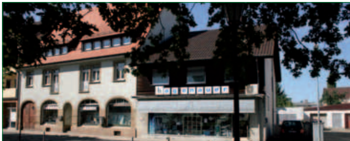
Blick in die Schwetzinger Straße