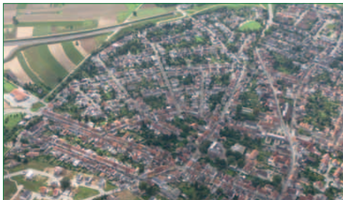
Plankstadt aus der Vogelperspektive