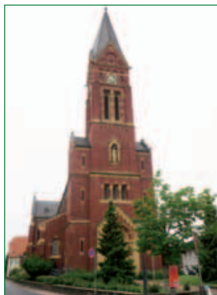
Katholische Kirche „St. Nikolaus“