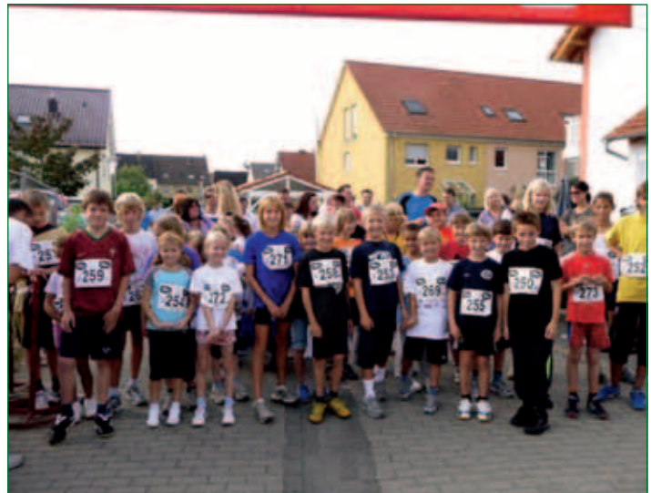
Aufstellung beim Bambini-Straßenfestlauf

Die Buslinie 713 Schwetzingen – Plankstadt – Eppelheim bietet eine komfortable öffentliche Personennahverkehrsanbindung an die Züge der DB AG im Bahnhof Schwetzingen, mit denen sich alle großen Ballungszentren