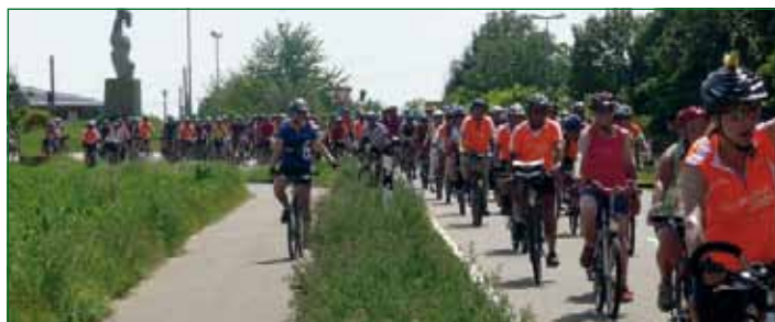
„Tour de Ländle 2010“ durch Plankstadt