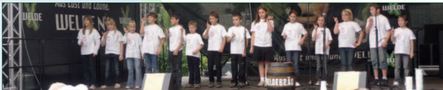
Schüleraufführung beim Straßenfest