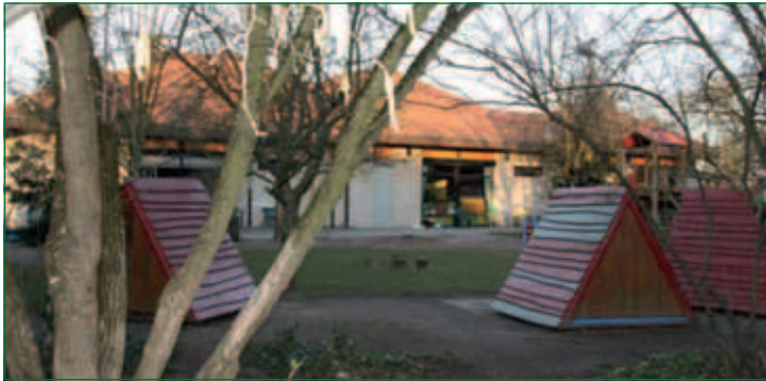
Katholischer Kindergarten „St. Martin“ Gutenbergstraße 24, Tel. 06202 16404