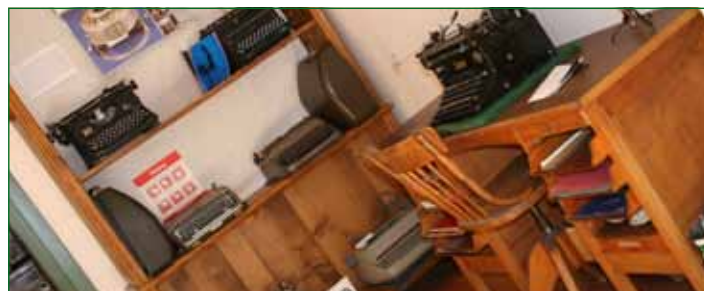
Impressionen aus dem Heimatmuseum