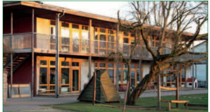
Evangelische Kindertagesstätte Plankstadt Schwetzingen Straße 7, Tel. 06202 923901